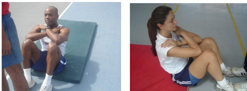
Figura 3 – Flexão de tronco sobre as coxas para os sexos masculino e feminino

Neste exercício serão exigidos os mesmos padrões de execução para ambos os sexos.