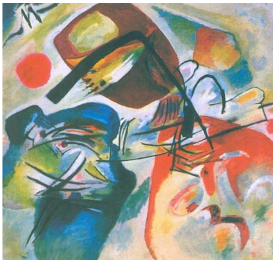
Com o arco negro Wassily Kandinsky, 1912

No início do século XX apareceram diversos movimentos artísticos em que se dispensava a representação de objetos e de temas da natureza, de maneira clara. A renúncia à figura era o caminho necessário para alcançar uma pintura pura. Wassily Kandinsky, foi o pioneiro desse movimento, que tem nomes como Piet Mondrian, Malevitch entre seus primeiros representantes. Observe a reprodução da obra que representa muito bem este estilo de pintura e assinale a resposta correta .