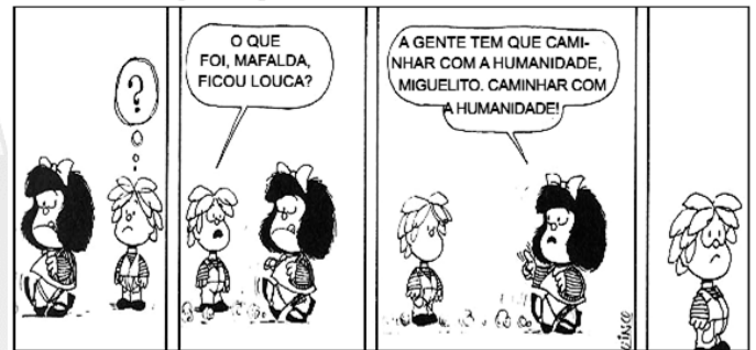
QUINO. Toda Mafalda. São Paulo: Martins Fontes, 2000. p. 95.

06. Considere a charge abaixo e assinale a alternativa correta.