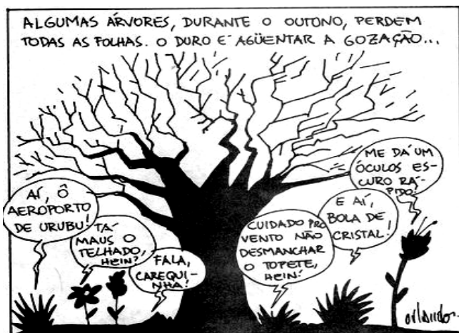
Orlando, Folha de S. Paulo, 26/5/1994.

7) As vírgulas presente no primeiro período podem ser substituídas sem alteração de sentido gramatical por: