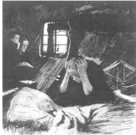
Kollwitz, Kathe. Necessidade, 1893-1901. Litogravura 15,5 x 15,2 cm

Questão 36) De acordo com a obra e o texto a seguir, indique a qual momento da Arte o autor se refere: