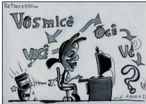
( http://linguanosblogs.blogspot.com/ )