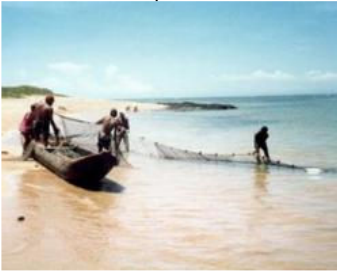
Pesca de arrastão em Manguinhos.

Meu nome é Ana Maria Machado e eu vivo inventando histórias. E dessas que eu escrevo, algumas viram livros. Adoro o meu trabalho. Ainda bem, porque acho que não ia conseguir viver se não escrevesse. Já fui professora, já fui jornalista, já fiz programa de rádio, já tive uma livraria e nesse tempo todo nunca parei de escrever.