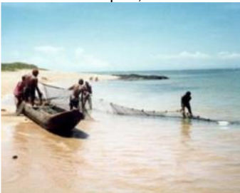
Pesca de arrastão em Manguinhos.

Meu nome é Ana Maria Machado e eu vivo inventando histórias. E dessas que eu escrevo, algumas viram livros. Adoro o meu trabalho. Ainda bem, porque acho que não ia conseguir viver se não escrevesse. Já fui professora, já fui jornalista, já fiz programa de rádio, já tive uma livraria e nesse tempo todo nunca parei de escrever.