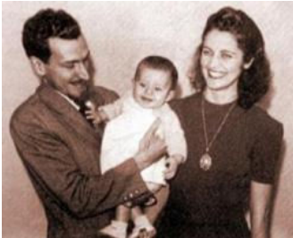
Eu e meus pais, em 1942.