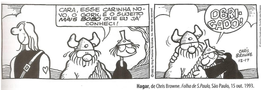
Hagar, de Chris Browne. Folha de S.Paulo, São Paulo, 15 out. 1993.

Leia este diálogo entre Hagar e seu amigo Eddie Sortudo e assinale a afirmação INCORRETA: