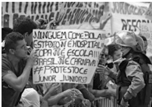
(Manifestação em Fortaleza em Junho de 2013)

Durante a realização da Copa das Confederações (junho de 2013), a imprensa nacional e internacional registrou inúmeras imagens de protestos ocorridos nas principais cidades brasileiras.