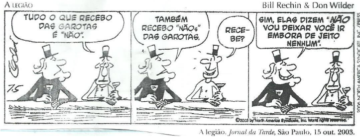
A legião. Jornal da Tarde , São Paulo, 15 out. 2003.

O vocábulo “NÃOs” no segundo quadrinho é um exemplo do seguinte processo de formação das palavras: