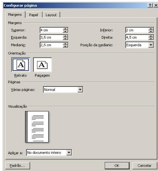
Figura 4 – Caixa de diálogo do programa Microsoft Word 2007

Para responder à questão 18, considere a Figura 4 abaixo: