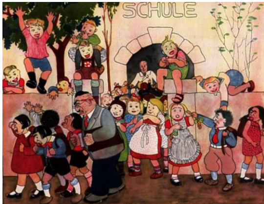
Imagem do livro infantil "Um antisemita".