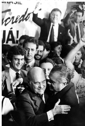
Após a vitória, Tancredo Neves recebe os cumprimentos de José Sarney e correligionários no Congresso Nacional

Em 2015 o Brasil comemora 30 anos do início da Redemocratização. Sobre esse período da história brasileira, é correto afirmar que: