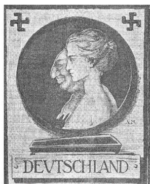
Wahlplakat zur Reichstagswahl (1920)